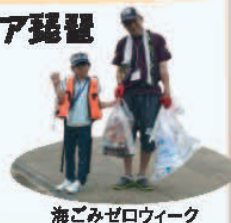
海ごみゼロウィーク