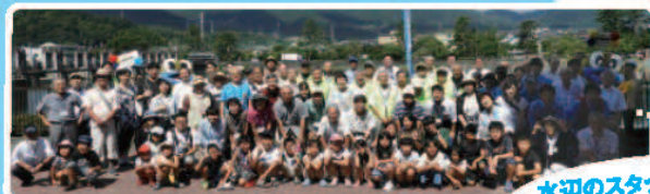
水辺のスタッフみんなでお待ちしております!