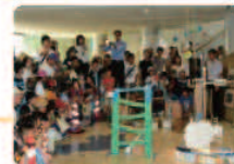
ビワゴラスイッチ