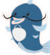
「水辺の匠」マスコットキャラクター たくみくん

ウォーターステーション琵琶 〒520-2279 滋賀県大津市黒津4-2-2 TEL.077-536-3520 受付時間9:00~17:00(毎週火曜休館)