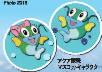
アクア琵琶 マスコットキャラクター