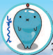
ウォーターステーション琵琶 マスコットキャラクター