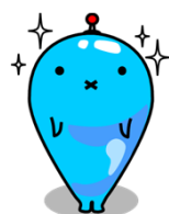
しずくくん (シンボルキャラクター)