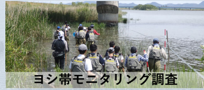
ヨシ帯モニタリング調査