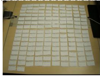
集まった一言カード

「一言カード」で、清掃参加者の意見や想いを集め、実施に反映 「一言カード」で、清掃参加者の意見や想いを集め、実施に反映 「一言カード」で、清掃参加者の意見や想いを集め、実施に反映