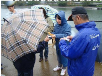
レンジャーからのカード配布

「一言カード」で、清掃参加者の意見や想いを集め、実施に反映 「一言カード」で、清掃参加者の意見や想いを集め、実施に反映 「一言カード」で、清掃参加者の意見や想いを集め、実施に反映