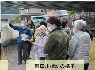
瀬田川探訪の様子