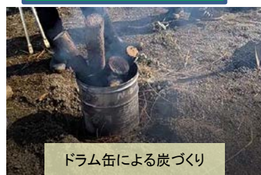
ドラム缶による炭づくり

野洲川は琵琶湖と行き来する水生生物が多くみられます。 河川レンジャー活動支援室からは、野洲川に住んでいる生きものを実際に見て触れてもらい、野洲川へのさらなる愛着を持ってもらうための水槽展示を実施しました。晩秋の水温も低くなる中で、ウツセミカシカやツチフキなど、あまり見かけない在来種も確認できました。