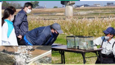
ウツセミカシカ ツチフキ