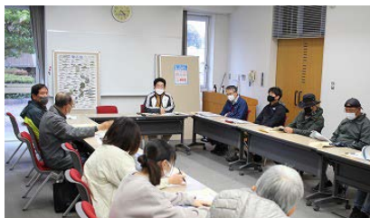
WS琵琶会議室でのふりかえりの様子