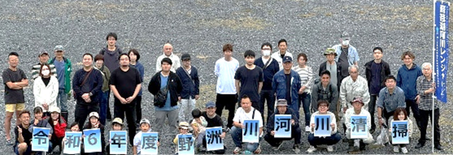
(株)レイマック、地元自治会(中洲学区長)、行政(琵琶湖河川事務所、守山市)の皆さん