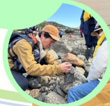
石の先生から楽しいお話も聞けました！