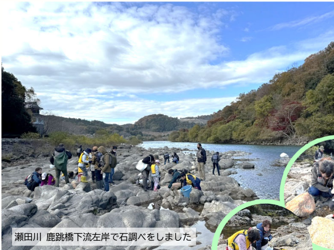
瀬田川 鹿跳橋下流左岸で石調べをしました

子どもたちが夢中になって楽しんでいました。大石の歴史を知ることでもでき、充実した時間でした。