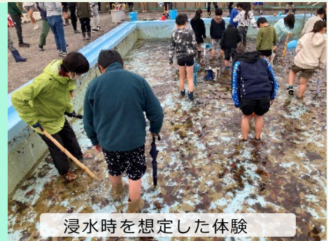
浸水時を想定した体験

小学校のプールを使って「浸水歩行体験」を実施しました。浸水歩行体験では、プール内を避難経路と想定し、浸水した状態で歩行できるかを体験しました。安全に歩行できるよう「傘」や「棒」を杖にし、子ども目線の工夫が見られました。