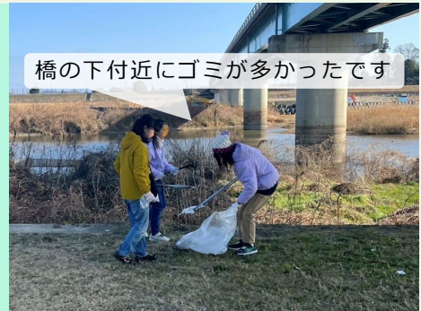
橋の下付近にゴミが多かったです

住民グループの親子13名のみなさん（普段から野洲川中洲親水公園あめんぼうにて活動されている）によるゴミひろいの活動をサポートしました。参加された住民からは「ずっとゴミが気になっていたので、気持ちがスッキリしました」という感想を伺いました。