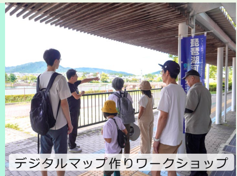
デジタルマップ作りワークショップ

令和7年度（2025）は、本格的な活動の1年目でした。デジタルマップ作りワークショップを通して、手ごたえと課題をつかんだ1年でした。