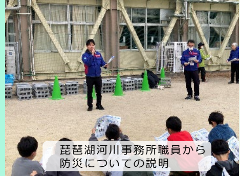
琵琶湖河川事務所職員から防災についての説明

昨年度に引き続き、南郷小学校の児童と防災かまど作りを実施しました。琵琶湖河川事務所職員から流域治水の取り組みや水害ハザードマップの見方を説明してもらい、避難の必要性に気づく場を提供してもらいました。その後に、避難所での生活を想定し、防災かまどを用いた火起こし体験を行いました。